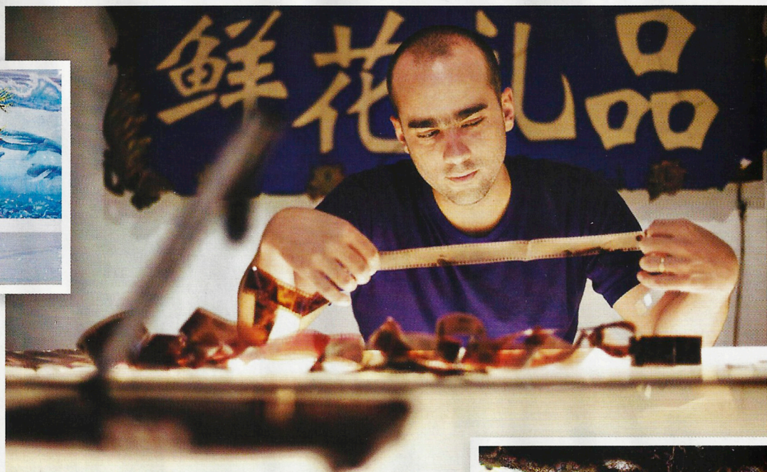
蘇文說：「損壞也是這些相片的美學。」