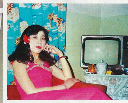
重溫與家庭電器的合照，見證了我們惜物的美好品格失落。