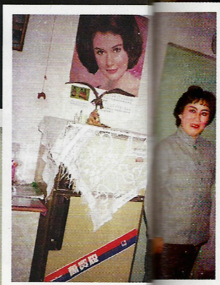
化一個粉墨登場的粧，與雪櫃合照。

放，人們的物質生活開始改善，逐漸把餘暇當一回事，隨着旅遊和娛樂的普及，相機開始進入尋常百姓家。雖然影相普及，這批相片告訴我們，八九十年代拍照仍是「正經事」，相中人大多位於正中，無論站或坐，都四平八穩，正面望鏡。閱讀相片，蘇文彷彿聽到有人在喊：「預備，一、二、三」。絕對不像現在話影就影般隨意。二〇〇六年數碼相機開始進入生活，所以這二十年，也是攝影技術的重大改變和伴隨而來的文化改變。