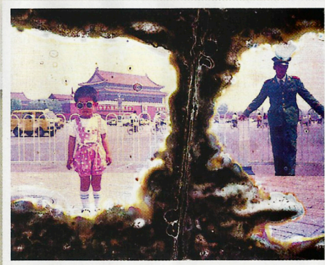
Sauvin從沒計劃追尋相中人。