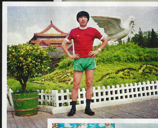
在還未有手機自拍的年代，拘謹屬拍照的常見情緒。