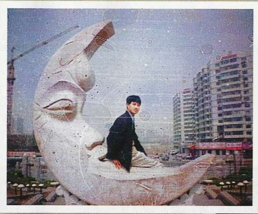
與史匹堡的夢工場商標不謀而合。

text | 麥獻宗 edit | Lucas art | Keith