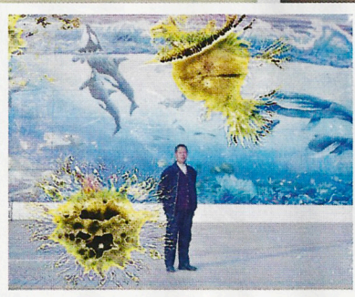
「損壞美」平添了照片欣賞的層次。